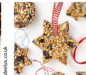
Kersthanger o.b.v. gelatine